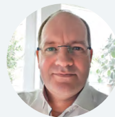
Jens Lück Bundesnetzagentur